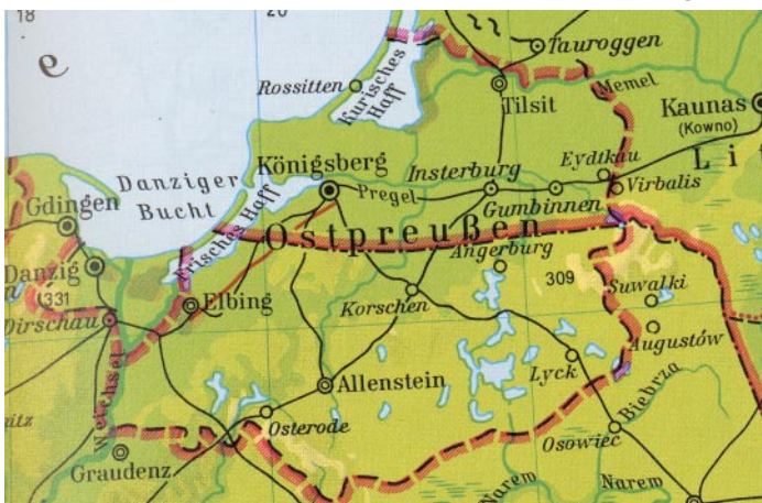
Nur wenigen noch bekannt und von den meisten Medien verdrängt - Ostpreußen und der gesamte deutsche Osten

in Königsberg setzt Schmidt nach. „Wer weiß denn, wie die Stadt heute heißt?“. Sofort hallt die Antwort zurück „Krakau!“. „Kraaaakauu. Nicht zu fassen! Sind Sie zum ersten Mal hier?“. Nachdem der Name Kaliningrad gefallen ist und auch die nächste Frage zur Zugehörigkeit des Königsberger Gebietes zu Rußland korrekt vom Publikum beantwortet worden ist, gibt sich Schmidt schon fast zufrieden. Fast. „Noch ein letztes. Was ist denn dieser weiße Fleck hier? Der war doch vorher noch nicht da?“ Der Stock schwingt zwi-