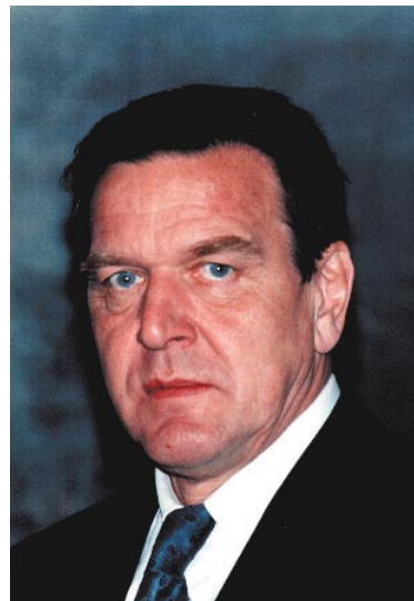
Stand nicht zu den Bürgern, sondern forcierte die Medienhetze gegen sein Land - Gerhard Schröder