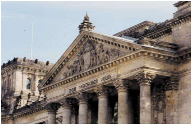
Gewidmet "Dem deutschen Volke" - Doch nicht alle Parteien im Berliner Reichstag fühlen sich ihrer Heimat wirklich verpflichtet.

orientierend vorangegangen ist. Damit ist eine Absage erteilt an Blutrache und Selbsthilfe und andere keineswegs theoretische Gebräuche. Zur Leitkultur gehört der durch Artikel 140 des Grundgesetzes geschützte