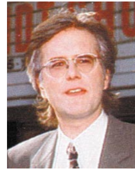
Gedenkt in seinen Sendungen gelegentlich der deutschen Ostprovinzen -

schen den 1871er und 1937er Karten hin und her. „Das ist der Korridor!“ schallt erneut die richtige Antwort aus dem Publikum. Nachhilfeunterricht braucht Schmidts Publikum trotz Krakau nicht. Die deutsche Jugend, jedenfalls das Schmidt-sche Publikum, ist nicht doof. Jedenfalls nicht so unwissend, wie jener norddeutsche Lehrer, der zwei Tage zuvor bei einer Quizshow die Ems in die Ostsee münden lassen wollte. - Ostpreußen bekannter als die Ems? Das stimmt hoffnungsfroh. Und