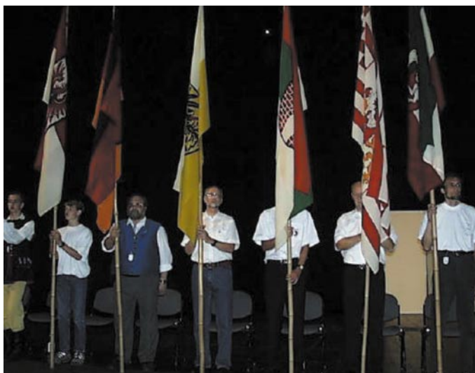
Ruft die verlorene Heimat aus der Tiefe der Zeit in die Mitte des Deutschlandtreffens - die Gesamtdeutsche Fahnenstaffel.