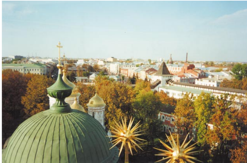
Die russische Kirchenmetropole Jaroslavl - Blick über die Stadt vom Glockenturm des Kreml

Anfang September kam ich, als Stipendiatin der Alexander-Herzen-Stiftung, nach Jaroslavl. Meine Aufgabe war es, in der dortigen Pädagogischen Universität an der Histori-