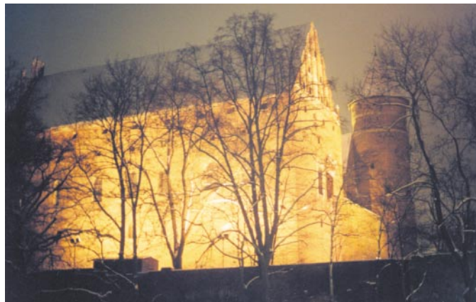
Strahlt majestätisch in die Winternacht - Das Allensteiner Stadtschloß.

Das Basteln dieser Formen ist nicht ganz einfach, und unsere Männer streiken gern dabei. Sie dürfen aber kleine Kugeln formen und eine Haselnuß hineinkneten, andere Kugeln bekommen obenauf eine halbe Walnuß. Zum Schluß wird