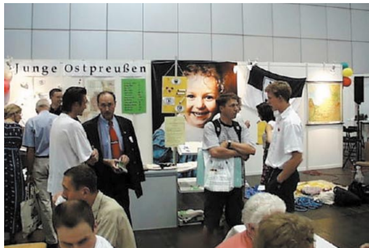
Lebendiger Treffpunkt, Informationsbörse und einer der Mittelpunkte des Ostpreußen-Treffens: Der Stand des Bundes Junges Ostpreußen

ten versehen. Hierzu gehörten u.a. ein echtes Kanu, das eigens aus Bayern mitgebracht worden war, und ein Zelt, die beide symbolhaft für die vielen Fahrten in das "Land der dunklen Wälder" standen. Für eine unserer wichtigsten Aufgaben widmete sich eine der Ausstellungen der Kriegsgräberarbeit. Hier konnten sich die Besucher über Ar-