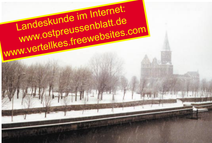
Königsberg im Winter - Der verschneite Kneiphof

Landeskunde im Internet: www.ostpreussenblatt.de www.vertellkes.freewebsites.com