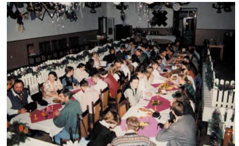
Ein voller Saal - Die BJO-Weihnachtsfeier in Osterode

Der Höhepunkt war jedoch die Weihnachtsfeier am Sonnabend, zu der sich die 95 Teilnehmer bereits vorher mit Plätzchenbacken, Basteleien und Raumschmücken vorbereite-