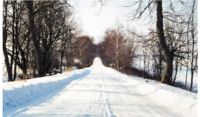
Ostpreußen im Winter - Allee bei Schlobitten / Kreis Pr. Holland

plünderten die verlassen Häuser? Die Angst ließ sie dem Kinde in der Wiege zuflüstern: „Wenn wir diese Nacht überstehen, laufen wir morgen über den See. Ich werde dich an meine Brust nehmen, mein Vögelchen. Ich werde dich ganz weich betten bei mir, mein Falterchen. Du