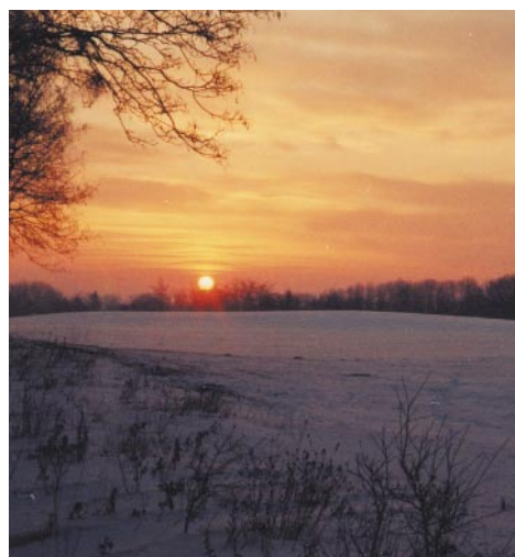
Sonnenaufgang an einem Wintermorgen