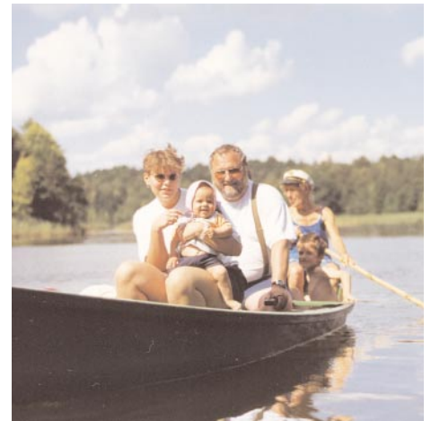
Sommerliche Bootsfahrt auf dem Kruttinner See